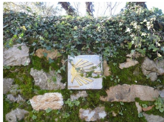
Vägmarkering längs leden