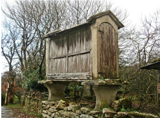
Horreo, vanligt förekommande torkklador eller visthusbodnar som används för att torka bl.a. majs.