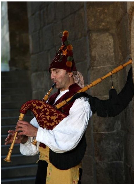
Speleman i Santiago de Compostela