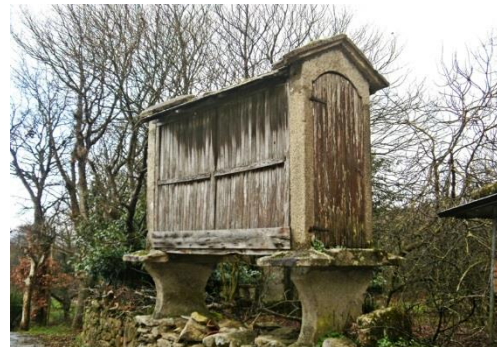
Horréu, vanligt förekommande torkklador eller vishusbodar som används för att torka bl.a. majs.