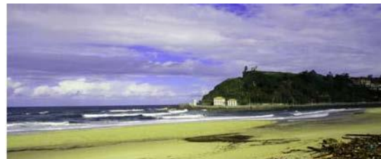
Stranden vid Ribadesella