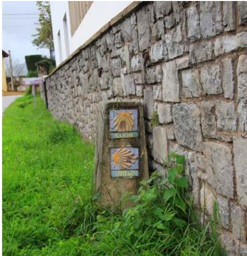
Caquita, leden delar sig