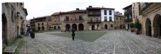
Plaza Mayor, Santillana de Mar