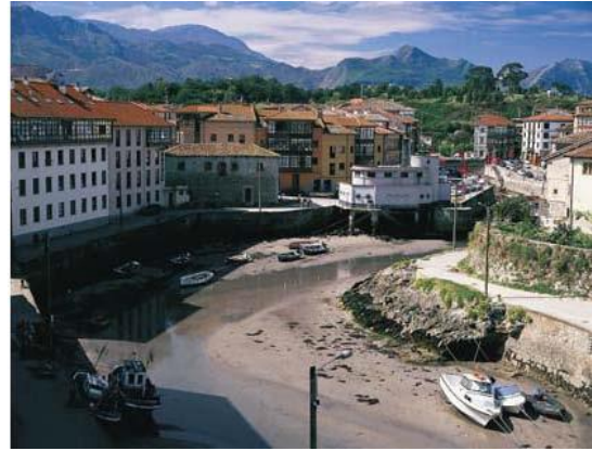
Ebb i Llanes