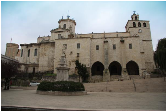
Katedralen i Santander

I Santander bor du första natten i ett lugnt område som ligger lite utanför den stressiga innerstaden. Utanför hotellet har du en av de långa sandstränderna som är ypperlig för bad eller bara en lugn och fin promenad. Hamnstaden Santander är huvudstaden i regionen Kantabrien och den är utbredd över ett stort område. Vill du se mera av innerstaden och besöka katedralen innan du startar din vandring så kan du antingen följa den långa hamnpromenaden till fots eller ta en av de många lokalbussarna in till centrum.