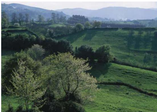
Det böljande landskapet