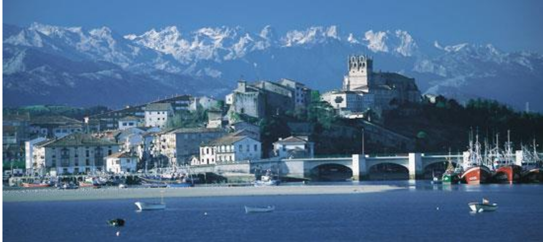
San Vicente de la Barquera