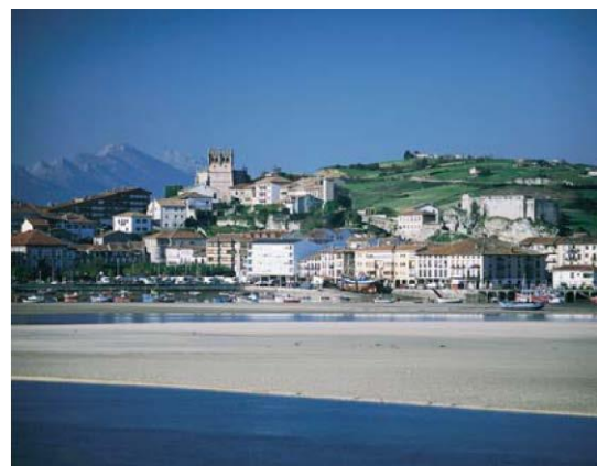
San Vicente de la Barquera