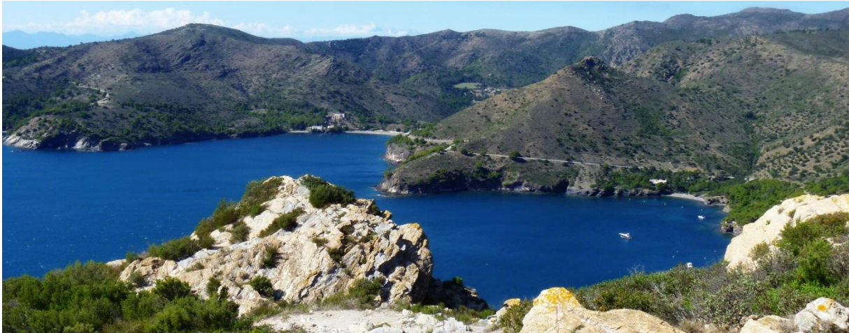
Utsikt över Montjoi från Torre de Norrfeu