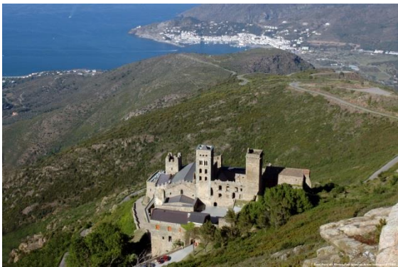
Klostret San Pere de Rodes