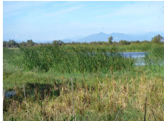
Els Aiguamolls de l'Empordà