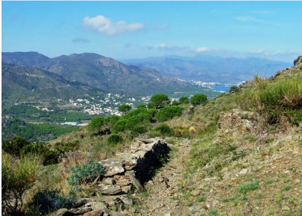
Utsikt över Port de la Selva