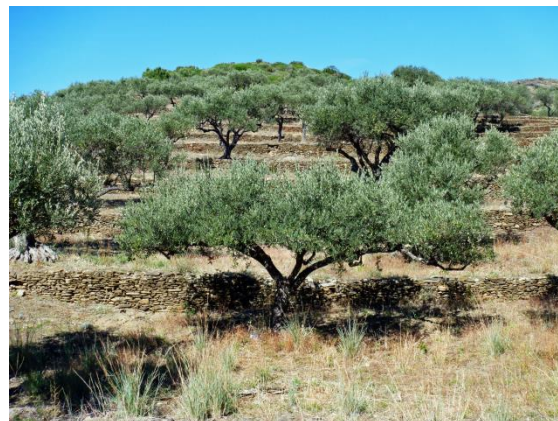
Terrasserade olivodlingar på väg till Cabo Creus