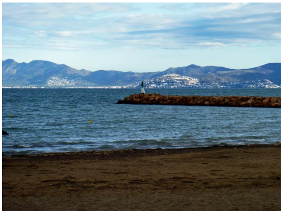
Utsikt över Golf de Roses