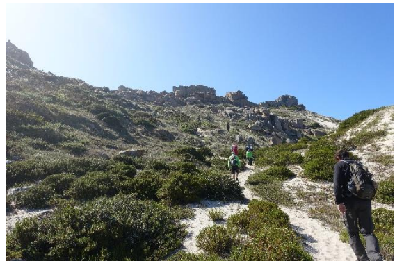
På väg upp mot sanddynerna