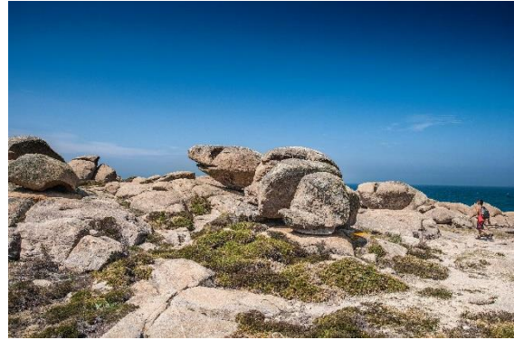
Vandring över klipporna