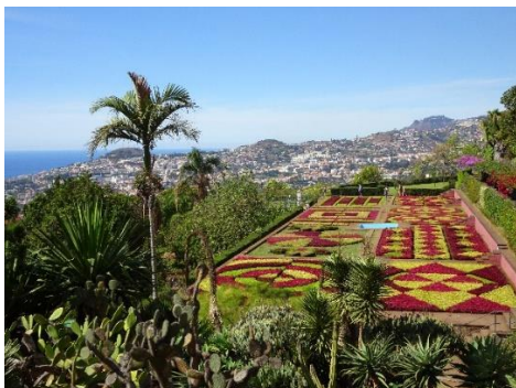
Funchal botaniska trädgårdar