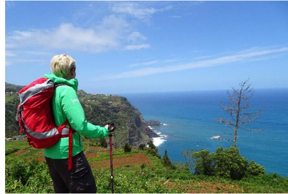
Utsikt över nordkusten