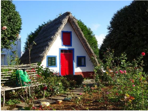
Madeiras traditionella hus