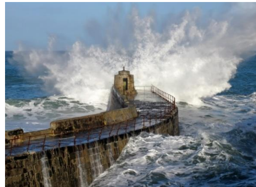
Vågorna slår in över Portreath