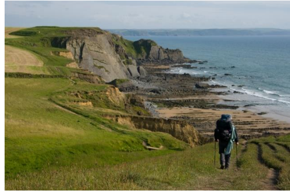
Vandrare South West Coast Path