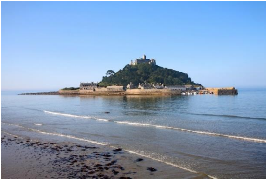
St Michaels Mount